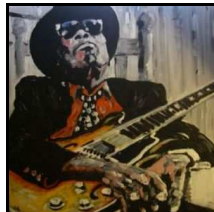
“John Lee Hoocker”