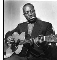
“Big Bill Broonzy”

Plusieurs axes de travail avec les élèves sont alors possibles :