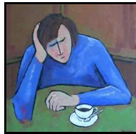
« Blues café » de Stephen Hewitt