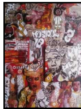
« Music 2 » de Nicoletta B.