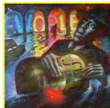
“New Orleans Blues” de Isheden