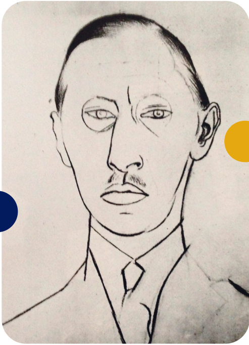
Igor Stravinsky (1882-1971), par Pablo Picasso, 1917